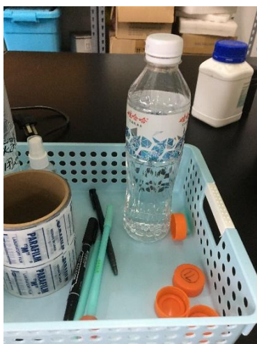
资环楼 A217—实验用矿泉水未撕去原标签、做标记