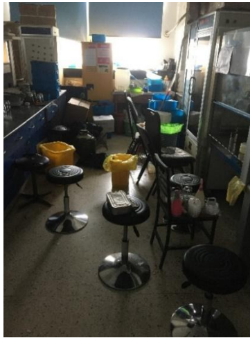
生科楼 B6015—实验室物品摆放杂乱