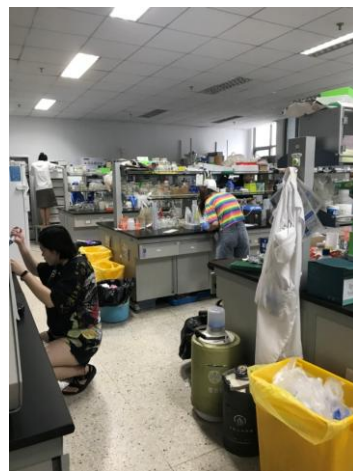
理科楼 B601—部分学生做实验时未穿实验服（左图初查，右图复查）