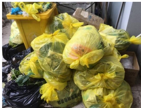
生科楼 B 座黄瓜实验室的大量实验室 废弃物堆放在六楼室外平台