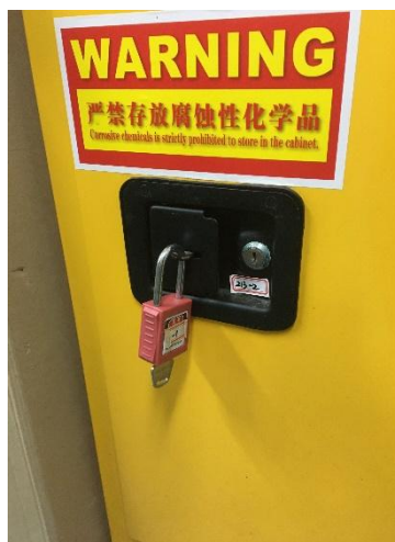
资环楼 A217—危化品柜用完未上锁 (且未在台账上登记)