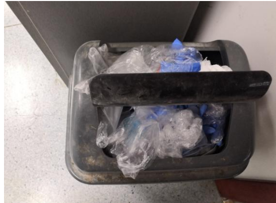
理科楼 A319—未使用黄色实验室废弃物专用垃圾袋（左图初查，右图复查）