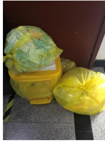
2楼B座西侧楼梯口一堆放实验室废弃物