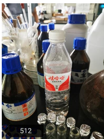
食品楼 512—实验用矿泉水未撕去原标签、做标记， (实验室还有多瓶矿泉水无任何标记，未一一拍照)， 每次检查都会出现这样的问题，已多次提醒整改