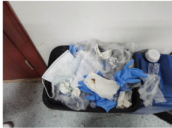
理科楼 A321—未使用黄色实验室废弃物专用垃圾袋且有食物垃圾（左图初查，右图复查）