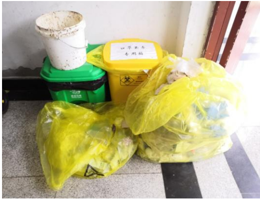
1楼B座西侧楼梯口一堆放实验室废弃物