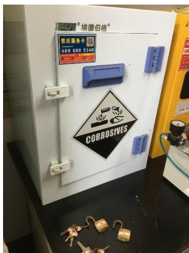
资环楼 A411—危化品柜用完未及时上锁